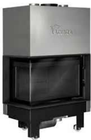
Izaro 80 CLI N