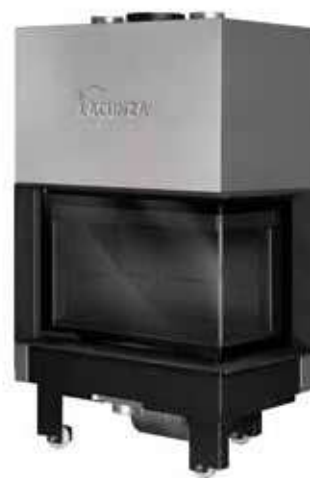
Izaro 80 CLD N