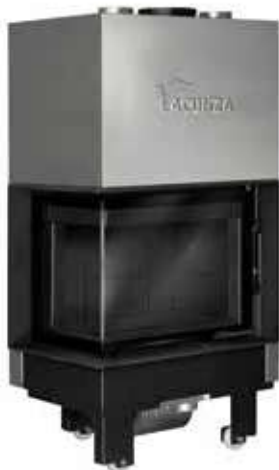
Izaro 60 CLI N

Uitwendig afmetingen 616 x 1460 x 630 mm