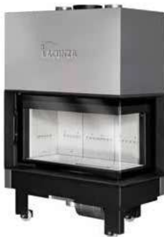
Izaro 100 CLD B