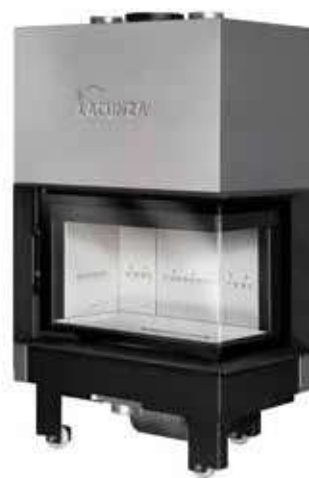
Izaro 80 CLD B