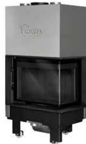
Izaro 60 CLD N