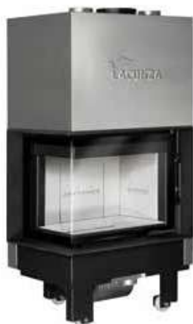
Izaro 60 CLI B

Uitwendig afmetingen 616 x 1460 x 630 mm