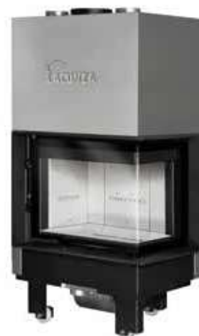
Izaro 60 CLD B