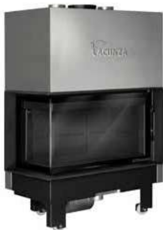
Izaro 100 CLI N