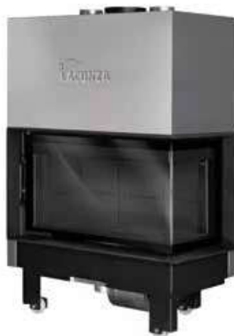
Izaro 100 CLD N