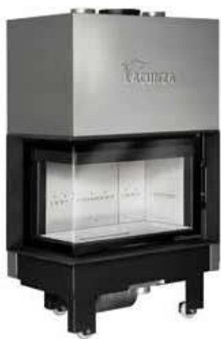
Izaro 80 CLI B