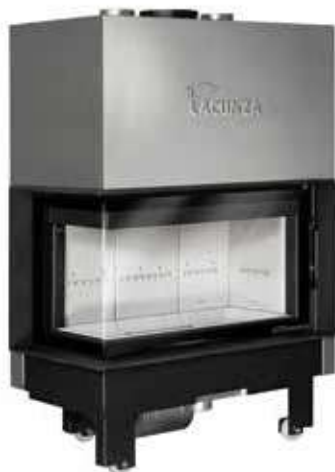
Izaro 100 CLI B